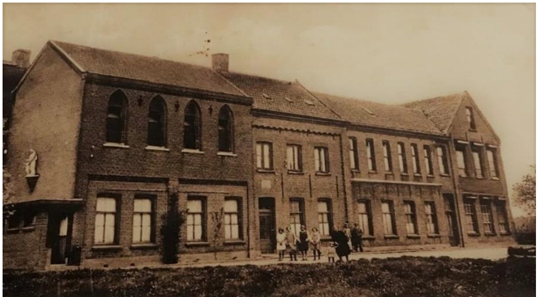
St. Jozephschool – Achthuizen

De naam De Achtsprong werd gekozen uit de inzendingen voor een prijsvraag.